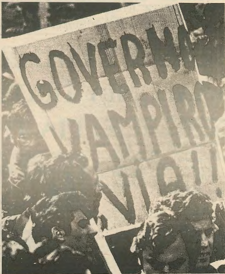
Να φύγει η κυβέρνηση - βρυκόλακας

Όλα τα δεδομένα οδηγούν στο συμπέρασμα πως ακόμα κι αν ξεπεραστεί η σημερινή κρίση με μια νέα